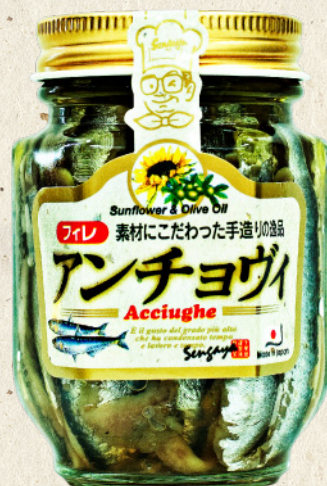
エキストラ・ヴァージン・オイル & ひまわり油