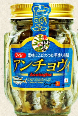
ごま油&ガーリック